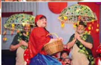
Der Elferrat erzählte die wahre Geschichte von Rotkäppchen

Die wahre Geschichte vom Rotkäppchen und dem bösen Wolf erzählte der Elferrat in einer lustigen und bunten Show. Auch