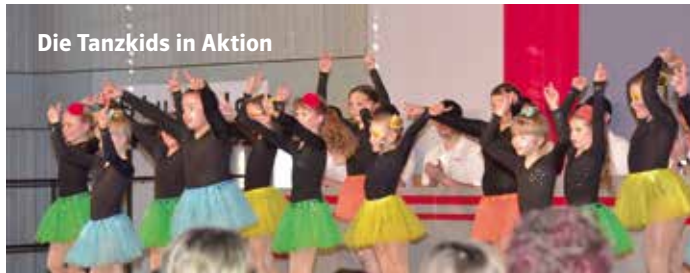
Die Tanzkids in Aktion

Clown, Einhorn, Fee, Polizist, Prinzessin, Spiderman usw. die Reihe ließe sich endlos fortsetzen. Eine bunte Schar von kostümierten Kindern und auch deren Eltern amüsierten sich beim Kinderfa-