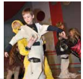
Auf die richtige Wickeltechnik kommt es an

Mit lustigen Spielen, vom Einwickeln zu einer Mumie, einer Verlosung mit schönen Preisen bis hin zu den begehrten Luftballons, Tanzen mit dem Prinzenpaar, den Gardemädchen oder den Männern des Elferrates ließen die Stunden für die Kinder wie im Fluge vergehen.