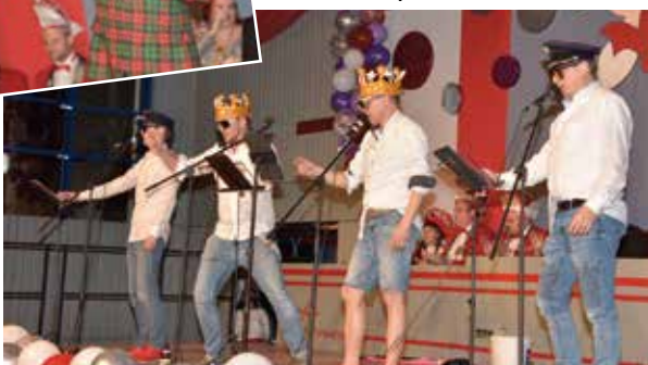
Stimmlich gewaltig: die Ipsheimer Feierwehrbänd

sent, aber auch befreundete Faschingsgesellschaften laden ihn gerne ein, um deren Programm mit seinen humorigen Reden zu bereichern. „Im Elferrat im schmucken Dress auf der Bühne, Tänzer in diesem Gremium, viele Jahre als Sitzungspräsident prägte er von Beginn an die Narrensitzung mit, Solo-Bünnenredner oder im Duo, aktiv im Narrenausschuss mit der Vorbereitung aller Faschingsveranstaltungen beim TSV Ipsheim beteiligt, hat er sich im Verein bleibende Verdienste erworben“ so der Redner.