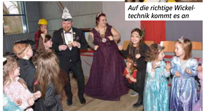
Es ist immer schön, mit dem Prinzenpaar zu tanzen

Mehr Bilder vom Fasching unter: tsv-ipsheim.de