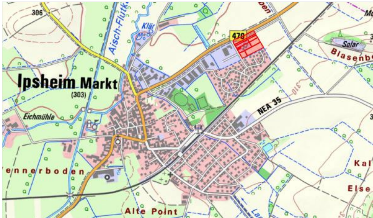
Kartenausschnitt mit Änderungsbereichen (Kartengrundlage © Bayerische Vermessungsverwaltung 2024)

Der Marktgemeinderat Ipsheim in seiner Sitzung vom 16.05.2024 die Aufstellung der Änderung des Flächennutzungsplanes im Bereich der 1. Änderung des Bebauungsplanes „Im Kleinen Feld III“ beschlossen.