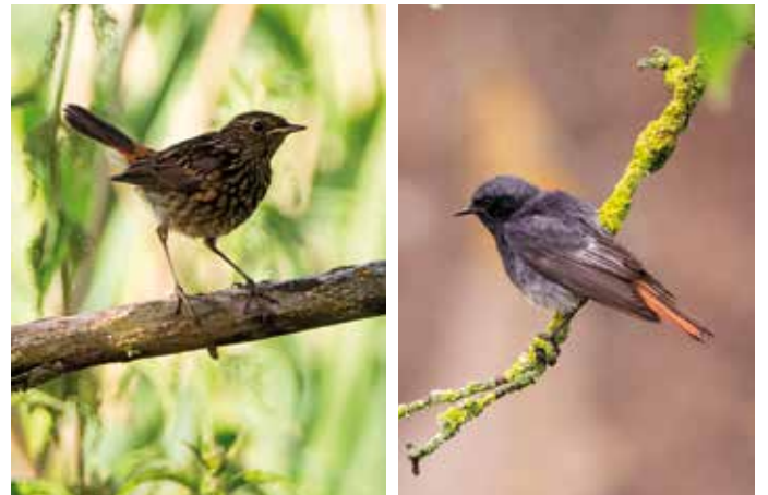
Weibliches und männliches Hausrotschwänzchen

Die Fotos eines weiblichen und eines männlichen Hausrotschwanzes zeigt unten Wolfgang Meyer, Fotograf der Kreisgruppe NEA-BW.