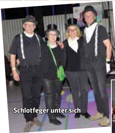
Schlotfeger unter sich