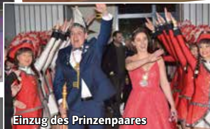
Einzug des Prinzenpaares