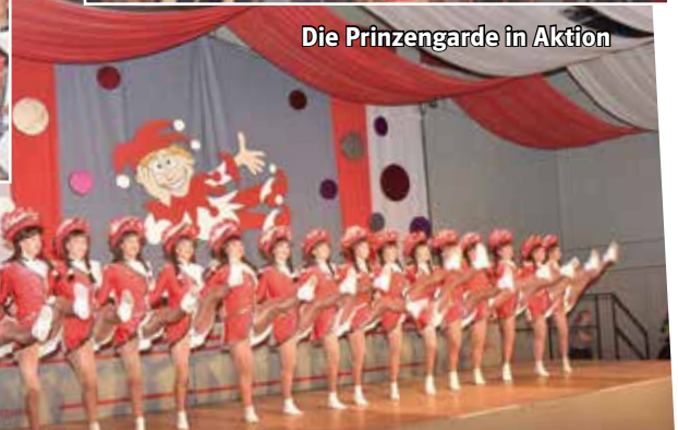
Die Prinzengarde in Aktion