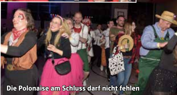
Die Polonaise am Schluss darf nicht fehlen