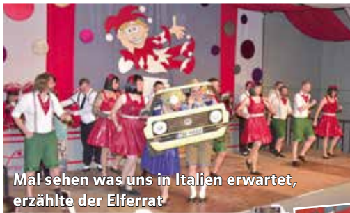
Mal sehen was uns in Italien erwartet, erzählte der Elferrat