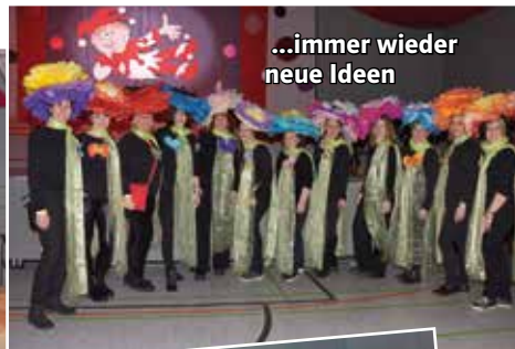
...immer wieder neue Ideen