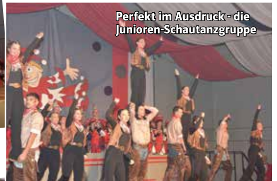
Perfekt im Ausdruck - die Juniorenschautanzgruppe