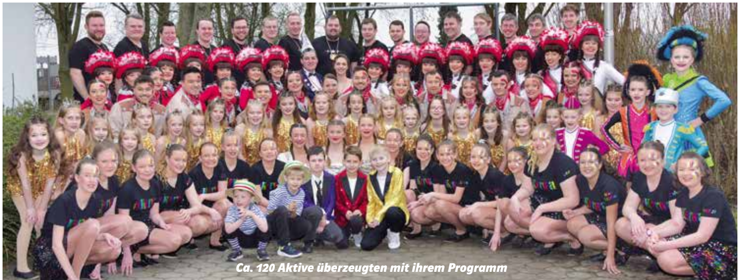
Ca. 120 Aktive überzeugten mit ihrem Programm

Das gesamte Programm das schon beim TSV Ball zu sehen war, erlebten die Kinder. Zusätzlich sangen und spielten die Schlagerkids Lieder von Wencke Myhre, Roberto Blanco und anderen Showgrößen. Lustige Spiele auf der Bühne, die gekonnt in Szene gesetzt wurden, kamen bestens an.