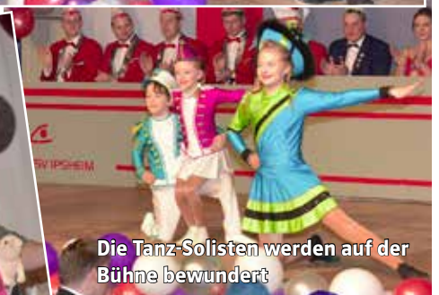
Die Tanz-Solisten werden auf der Bühne bewundert