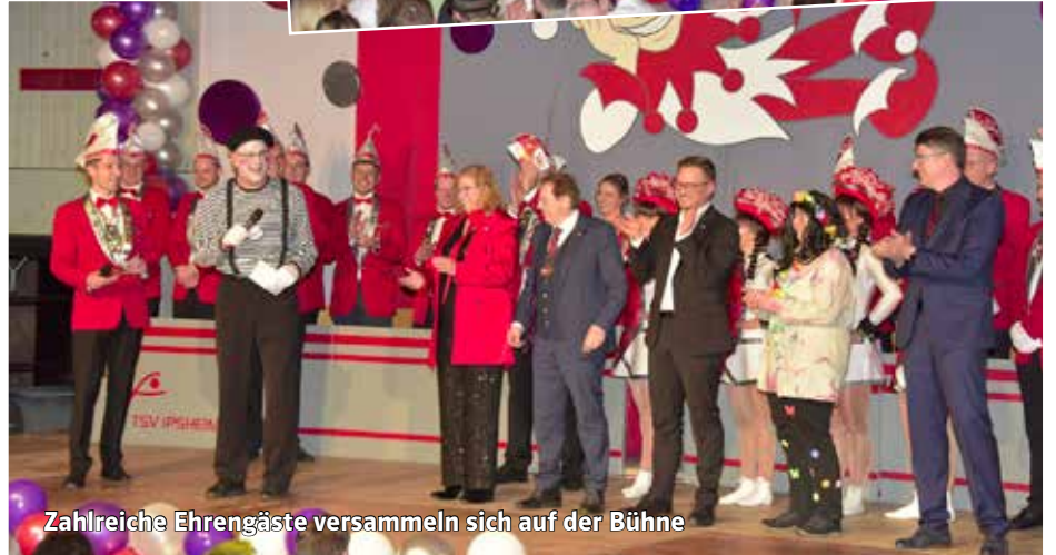
Zahlreiche Ehrengäste versammeln sich auf der Bühne