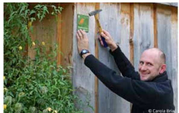
Ein Gartenbesitzer mit der Auszeichnungsplakette „Vogelfreundlicher Garten“

Weitere Infos sowie der Anmeldebogen finden sich unter www.vogelfreundlichergarten.de .