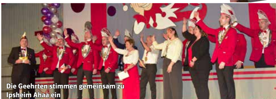
Die Geehrten stimmen gemeinsam zu Ipsheim Ahaa ein