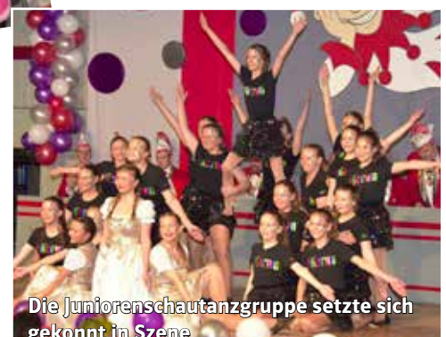
Die Juniorenschautanzgruppe setzte sich gekonnt in Szene