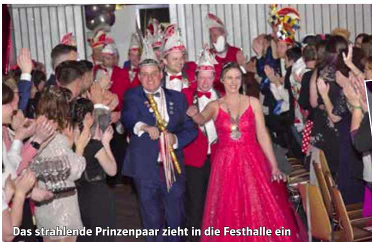
Das strahlende Prinzenpaar zieht in die Festhalle ein