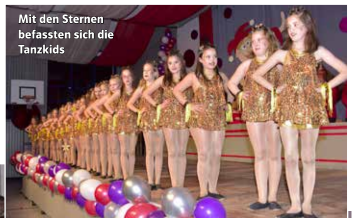
Mit den Sternen befassten sich die Tanzkids