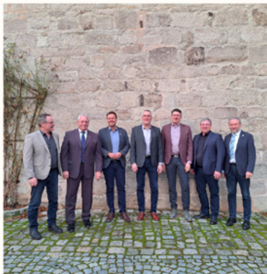
die 7 Bürgermeister der Kommunalen Allianz NeuStadt und Land

Aktuelle Informationen sind auch auf unserem Facebook- und Instagram-Kanal zu finden.