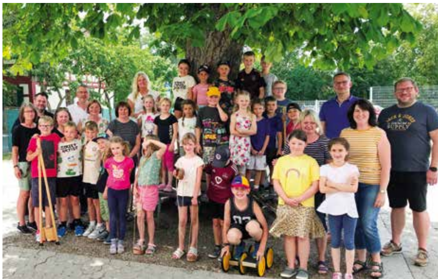
Spendenübergabe an die Mittagsbetreuung der Grundschule Ipsheim.

Der Verein fIKuS hat sich zum Ziel gesetzt, Begegnungen zwischen Erwachsenen und Kindern – mit und ohne Behinderung – zu ermöglichen und im sozialen Bereich zu unterstützen, wo staatliche Hilfen nicht ausreichen. Einnahmen generiert der Verein nicht nur durch Mitgliedsbeiträge und Spenden, sondern auch durch den Ipsheimer Adventsmarkt, den der Verein Ende November jährlich veranstaltet. 2022 hatte sich auch die gfi-Mittagsbetreuung mit einem Stand eingebracht.